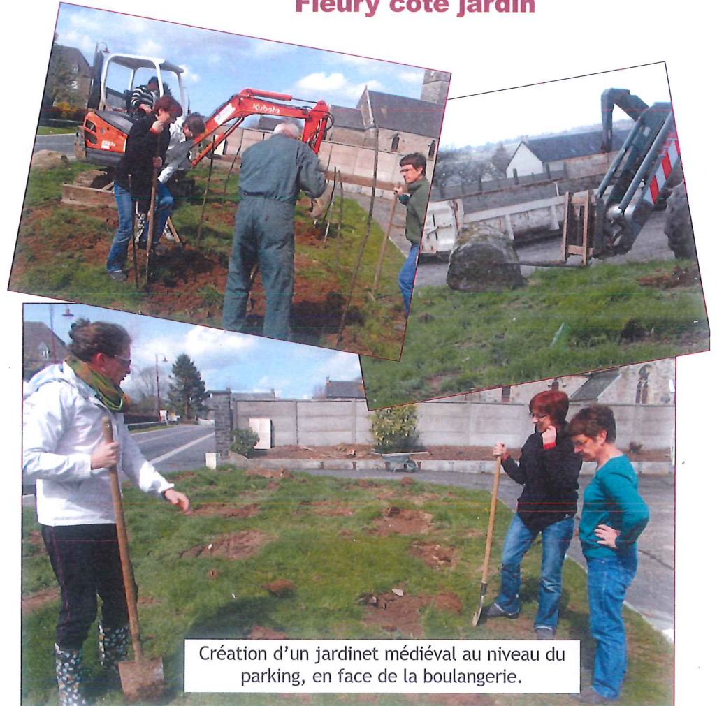
Création d'un jardinet médiéval au niveau du parking, en face de la boulangerie.